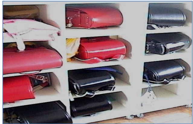
Pamje nga brendësia e klasës, ulëset dhe raftet për vendosjen e çantave.