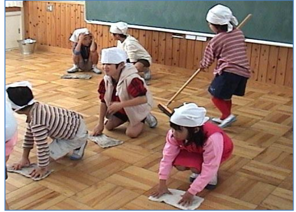
Nxënësit, po kështu, pastrojnë bashkërisht edhe dyshtemenë e klasave.